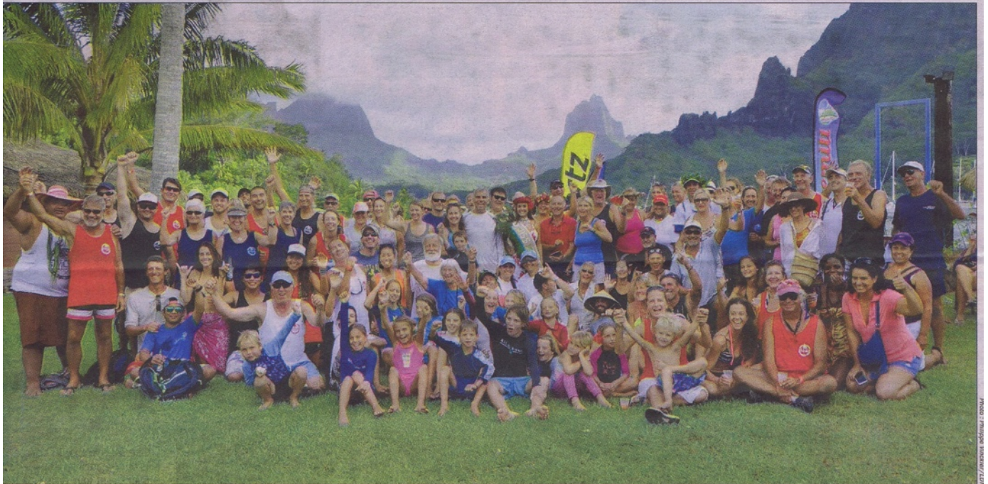
Photo de famille pour les participants au rallye à la voile.