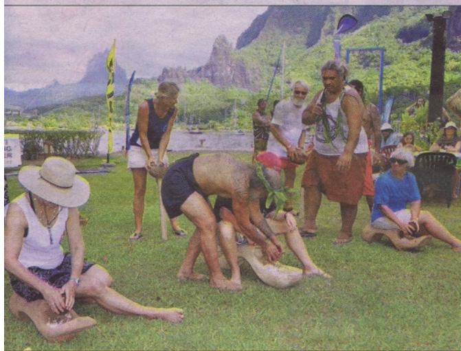
Le décoquillage du coco n'a plus de secret pour les participants.